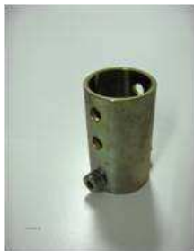
Maniguet per tub