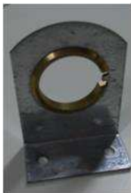
Coixinet per tub