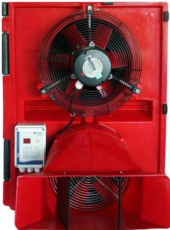
Regulador instalado en el recuperador